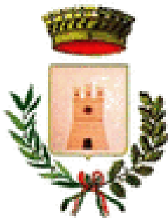
Comune di Farindola