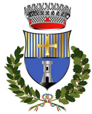
Comune di Civitella Casanova